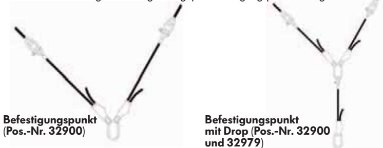
Befestigungspunkt (Pos.-Nr. 32900)

Die maximale zulässige Belastung beträgt pro Befestigungspunkt 100 kg lotrecht.